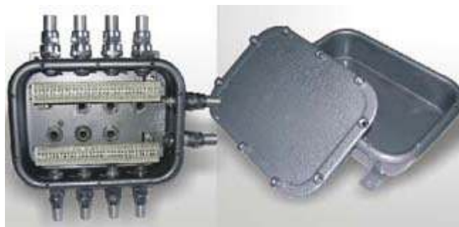
КП-48-00-(2)-38-00-Б4Г4В2-Г1/2-06-01-12 Комплект КП-48 (корпус + крышка)